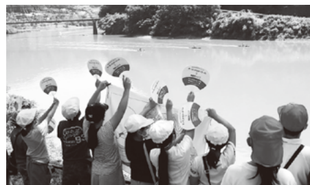
(2021年7月) 东京奥运波兰皮划艇队的公开训练 小朋友们拿着亲手制作的波兰国旗小扇子 为他们加油